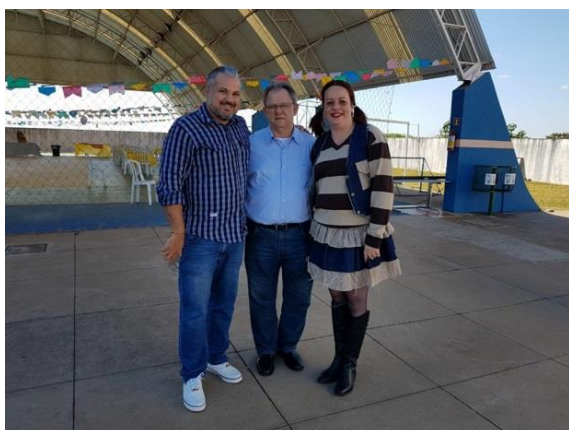
Festa Julina com crianças dos Centros de Integração, Idosos do Centro de Convivência do Idoso - CCI e servidores. Local: Centro da Juventude. Av. Pref. Pedro Viriato de Souza Filho, 303 - Jardim Tropical I, PR.