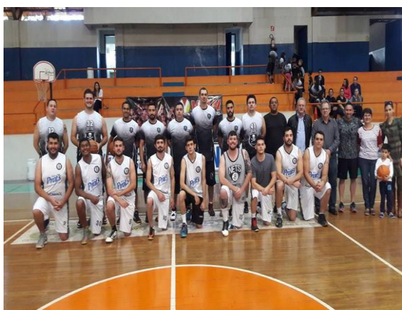
Abertura do Cidadão Fecam de Basquete Troféu "NESTOR GRINGO FERNANDES", com a realização de dois jogos;