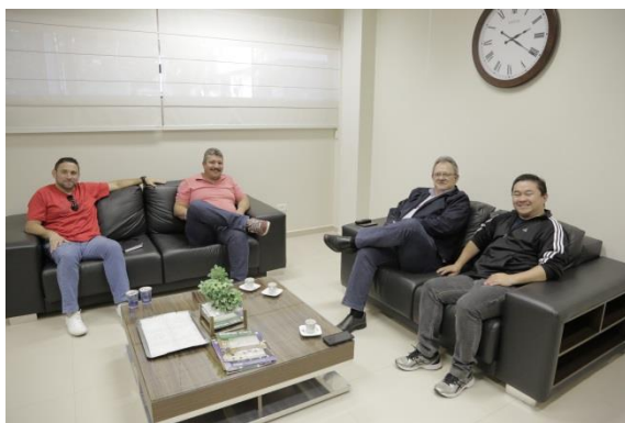
VISITA dos coordenadores do Campo Mourão Basquete.