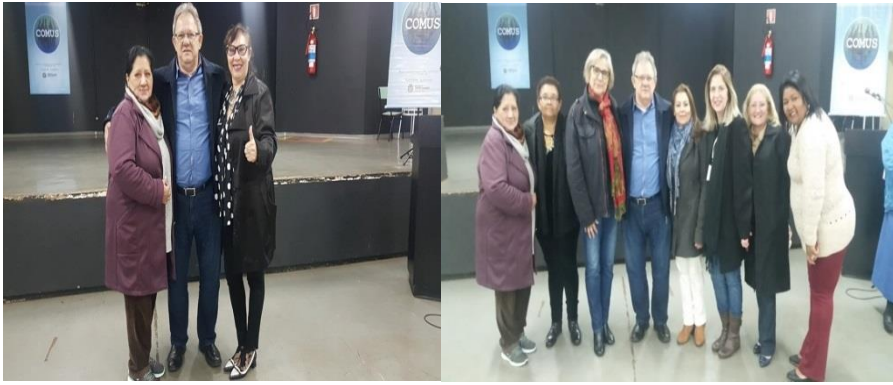
Participei da posse do Conselho Municipal de Saúde.