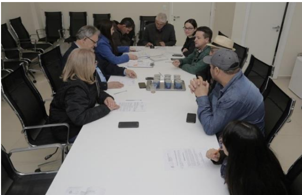
A Comissão de Finanças e Orçamento da Câmara, da qual sou o presidente, reuniu-se para analisar e dar parecer em vários projetos de Lei. Dentre este, dois importantes para a agricultura familiar. Um que altera a Lei do Conselho de Desenvolvimento Rural e outro que Cria o Programa de Apoio a Agricultura Familiar.