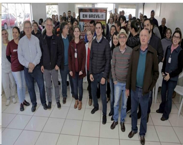
Participei do lançamento do festival de prêmios da Santa Casa Regional. Como nas edições anteriores foram colocadas à venda 50 mil cartelas ao preço de 10 reais.