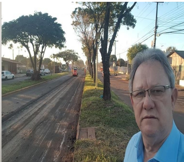
Vistoriando o início das obras de recuperação do pavimento da Av. Presidente Kennedy, no trecho do COHAPAR, realizadas pelo DNIT. Solicitando a recuperação da via, apresentei, no início de 2019, requerimento na Câmara Municipal dirigido ao órgão, o qual foi aprovado pelos demais vereadores.